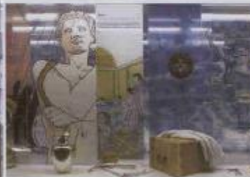
Vitrine »Badealltag bei den Römern«