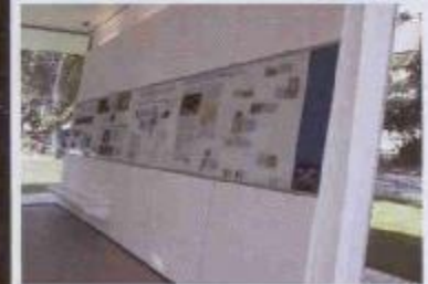
Beispiel, Wandansicht Informationstafeln

Ausführlich widmet sich die Ausstellung dem Mosaik. Nach Informationen zur Vielfalt in der Mosaikkunst wird an Hand von Beispielen gezeigt, was das Römer-Mosaik in Bad Vilbel zu einem Meisterwerk macht. Der kleine »Einführungskurs« animiert die Besucher sich das Mosaik genauer anzusehen und selbst das Kunstwerk zu entdecken.