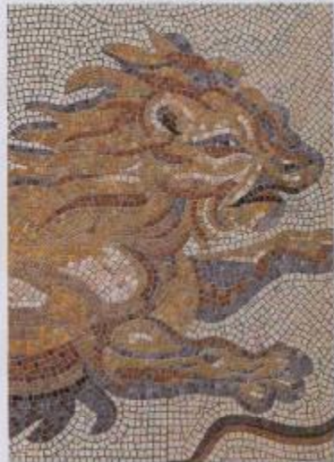
Detail, Gesamtansicht Römer-Mosaik

Das rund 33 m 2 große Römer-Mosaik besticht durch seine Lebendigkeit. Sie wird erreicht durch die abgebildeten Figuren selbst, die Komposition und die kunstvolle Anordnung der Mosaiksteinchen. Verstärkt wird der Eindruck noch durch das Wasser, das – wie in der Antike – über das Mosaik fließt und die Figuren scheinbar zum Leben erweckt.