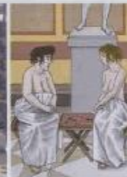
Illustration aus Vitrine Thema Unterhaltung