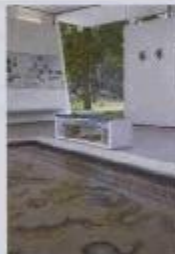
Site-Vitrine Fundstücke, Bad Vilbel

Eine Vitrine mit Illustrationen und Repliken von Badeutensilien lässt die Atmosphäre des Badealltags spüren. Zwei weitere Vitrinen zeigen einen Teil der wenigen Originalfunde, die von dem Badegebäude erhalten sind, überwiegend Bauteile der Fußboden- und Wandheizung.